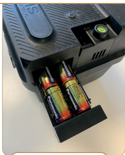
4 PILES LR14C

4. CHOISISSEZ ENSUITE LE MODE D'ALIMENTATION QUE VOUS DÉSIREZ (LES DEUX MODES SONT FOURNIS).